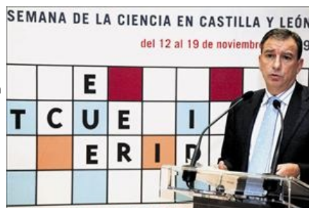
El consejero de Educación durante la inauguración de la séptima edición de la Semana de la Ciencia.

En la séptima edición de la Semana de la Ciencia han colaborado 80 entidades en la programación de las actividades como ayuntamientos, diputaciones provinciales, fundaciones de los parques científicos de las universidades, centros de investigación, institutos de secundaria, entidades de ahorro, destacando la participación de 37 empresas con base científica y tecnológica ubicadas en Castilla y León.